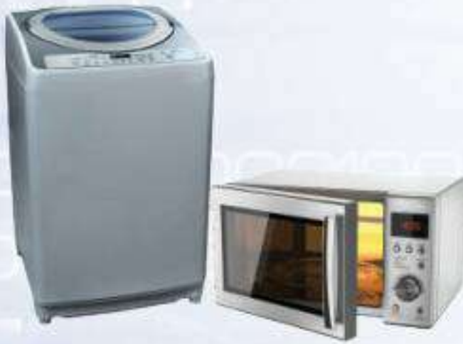
شكل (١-١): أمثلة على أجهزة رقمية

نعيش اليوم في عالم انتشرت فيه التقنية الرقمية وأصبحت من أهم ملامح العصر، ولها دورها الواضح في تطور كثير من جوانب الحياة، فمثلاً يمكننا مشاهدة ما يحدث في العالم على مدار الساعة، وإنجاز كثير من المهام اليومية كالتسوق، وحجز المواعيد، ودفع الفواتير وغيرها باستخدام أجهزتنا المحمولة، وهواتفنا النقالة. كما أصبح من السهل القيام بالكثير من المهام المنزلية مع وجود أجهزة إلكترونية حديثة مثل غسالة الملابس الأتوماتيكية، وجهاز المايكرويف وغيرها شكل (١-١) .