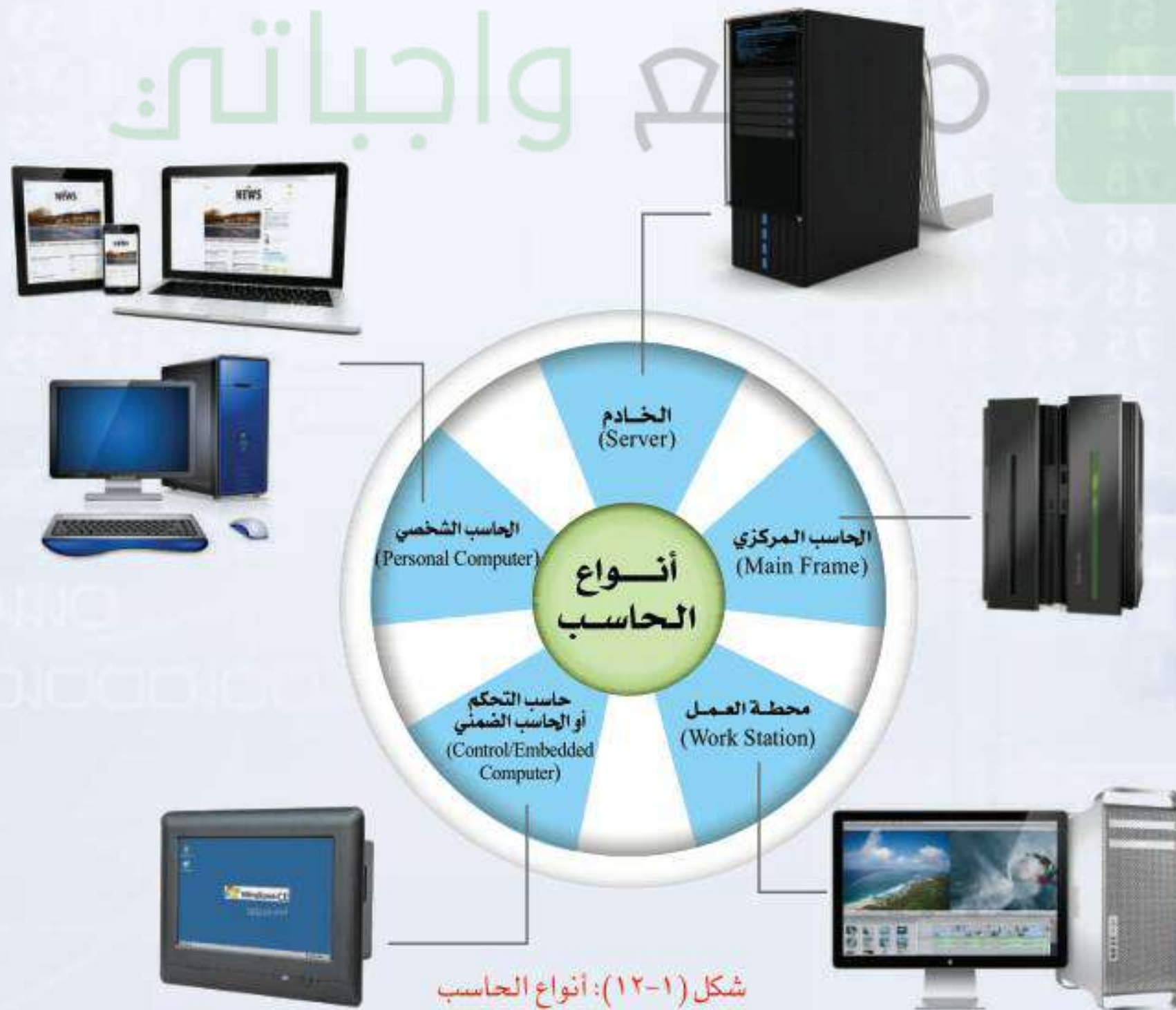
شكل (١٢-١): أنواع الحاسب

والشكل (١٢-١) يعبر عن ملخص لأنواع الحاسب السابق ذكرها.