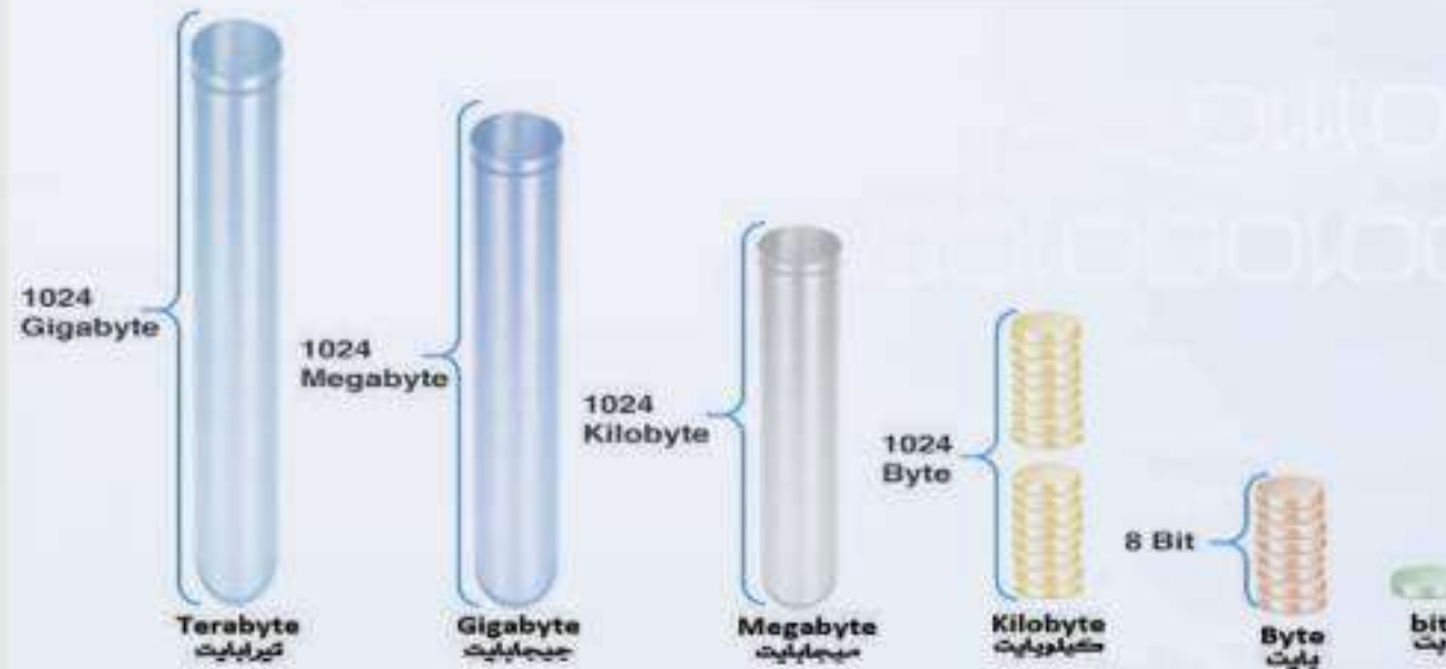
شكل (٤-١): وحدات قياس كميات البيانات في الأجهزة الرقمية