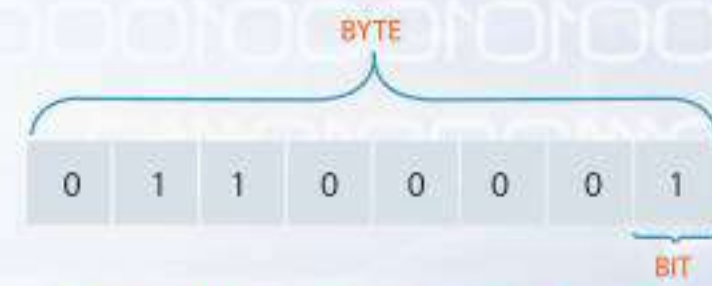
شكل (٣-١): البايت (Byte) يساوي 8 بت (Bit)

البت (Bit): أصغر وحدة تخزين في الحاسب وهي تمثل الإشارة الكهربائية إما ON (1) ، أو OFF (0).