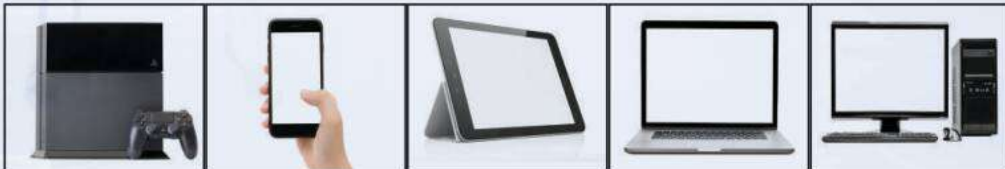
أجهزة الألعاب الإلكترونية الهاتف الذكي جهاز لوحي الحاسب المحمول الحاسب المكتبي

ما الفرق بين الحاسب المحمول والحاسب اللوحي؟