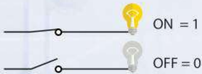
شكل (٢-١): تحويل البيانات إلى إشارات كهربائية

في الحقيقة إن الأجهزة الرقمية هي أجهزة تعتمد على الكهرباء في عملها، وبالتالي فهي لا تدرك اللغات البشرية، بل تقوم بتحويل كافة البيانات من نصوص أو صور أو أصوات أو مقاطع مرئية إلى إشارات كهربائية، وهذه الإشارات لا تخرج عن حالتين: إما (تشغيل/ ON) إذا كانت الدائرة مغلقة وعندها سيمر التيار الكهربائي، وهذا يعني أن هناك إشارة كهربائية وستُمثل بالرقم (1)، أو (إطفاء/ OFF) إذا كانت الدائرة مفتوحة وفي هذه الحالة لن يمر التيار الكهربائي بمعنى أنه لا توجد إشارة وستُمثل بالرقم (0) كما في الشكل (٢-١) . من هنا نصل إلى أن البيانات يتم تمثيلها داخل الجهاز الرقمي بأرقام مكونة من (0) و (1)، ويطلق عليها أرقام ثنائية (Binary Digits)، ويقاس كل رقم منها بوحدة قياس تسمى بت (Bit).